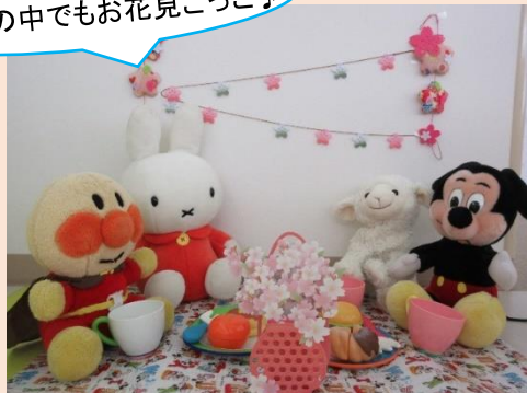
ままごとコーナーのひとコマより